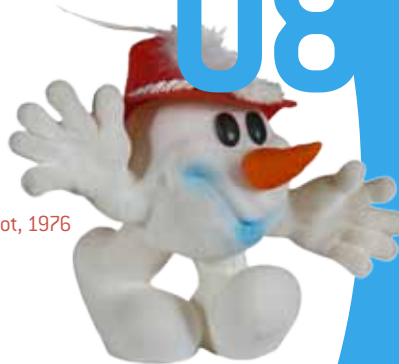
Olympia Maskottchen „Schneemann“, 1976 Olympic snowman mascot, 1976