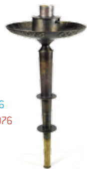
Modell Bergisel-Schanze, 1976 Model of Bergisel ski jump, 1976