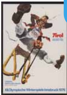
Olympia Plakat, 1976 Olympic poster, 1976